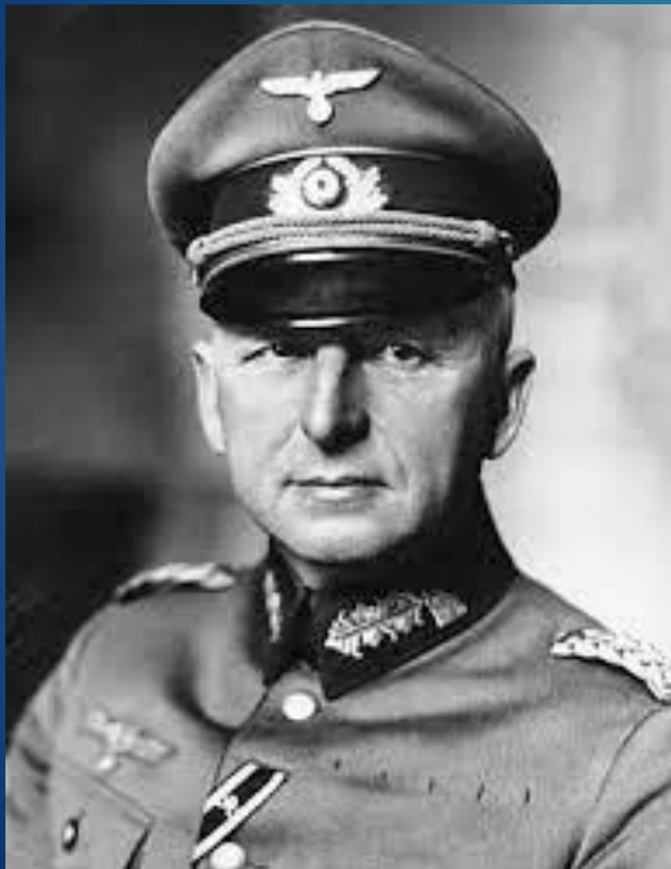
Гюнтер Ханс фон Клюге