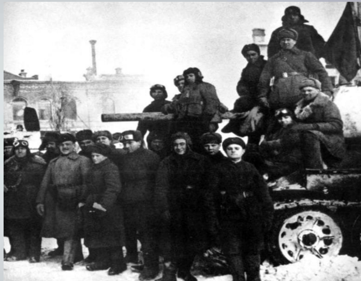
Победители. Групповой снимок «на память в освобожденном Сталинграде». Февраль 1943 г.

3. Победоносное завершение операции «Кольцо», и вместе с ним Сталинградской битвы, вызвали всеобщий подъём не только в Советском Союзе, но и у его союзников – в США и Великобритании; а также в оккупированных странах. Это была важная политическая победа, приведшая к ускорению распада гитлеровского блока, зарождению внутриполитического кризиса в Италии, Венгрии и Румынии.