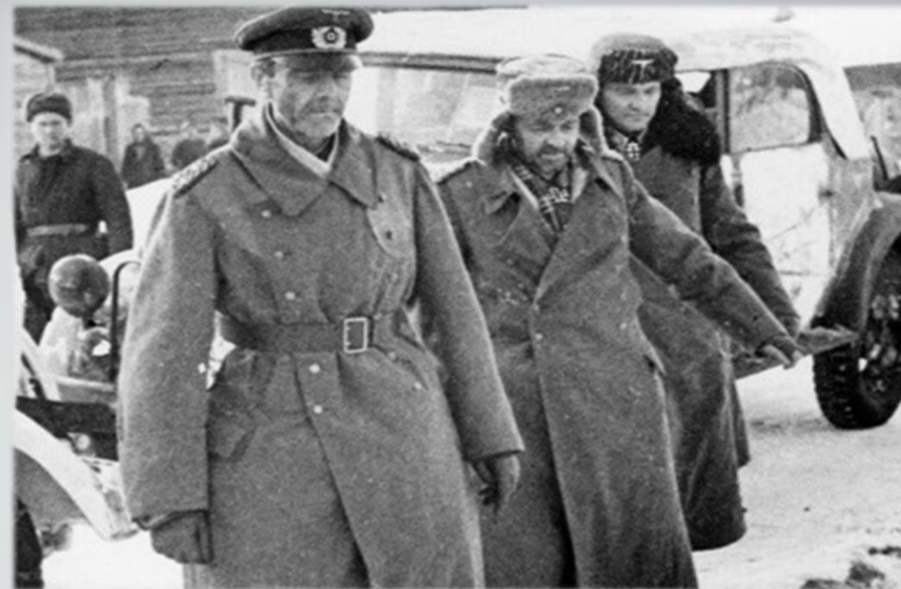
Пленение немецкого генерал-фельдмаршала Ф. Паулюса