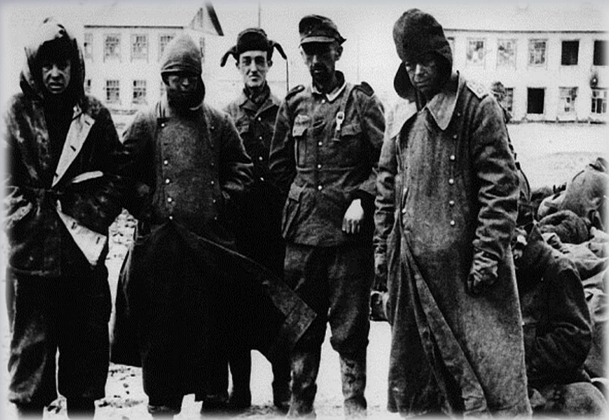
Пленение генерала-полковника К. Штреккера

Северная группа во главе с генералом К. Штреккером отказалась подчиниться этому приказу и продолжила сопротивление.